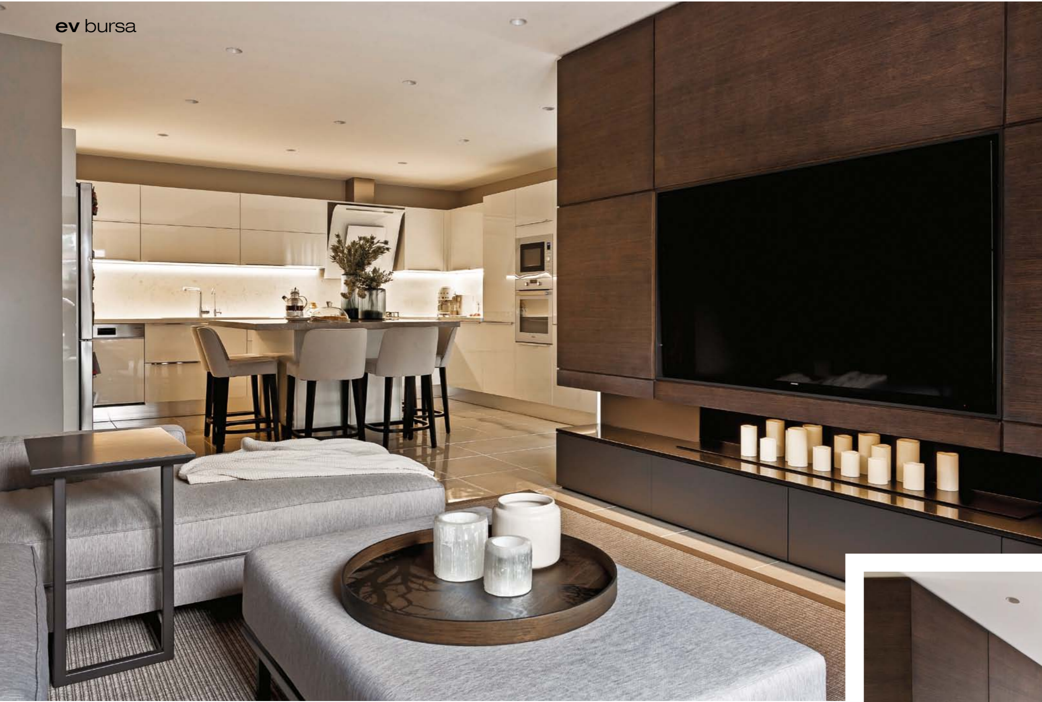
İç mimar Buket Efendioğlu