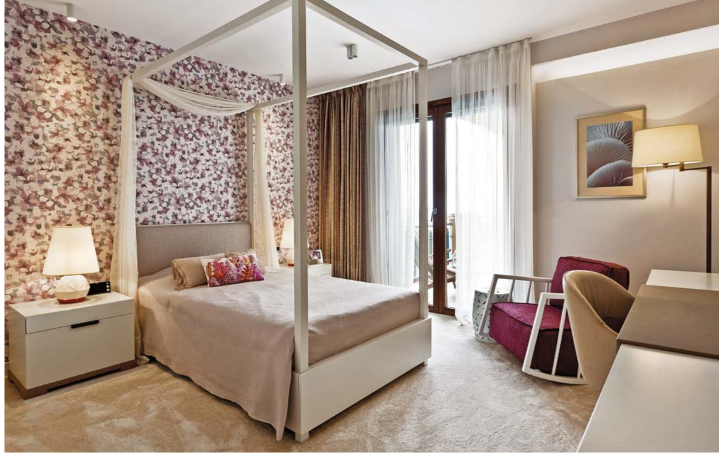
Çocuk odasındaki sallanan sandalye, Hamm firmasına ait. Seramik tabure, Mudo Concept. Aydınlatmalar, Limazzi marka. Duvar kağıtları, Duvar Art ve yastıklar ile yatak örtüleri, Zara Home'dan seçilmiş. Ebeveyn odasındaki mobilyalar özel üretim. Mavi berjer, Mobi marka. Sehpa, Four&More. Lambader, Phare Design ve abajurlar, Limazzi.