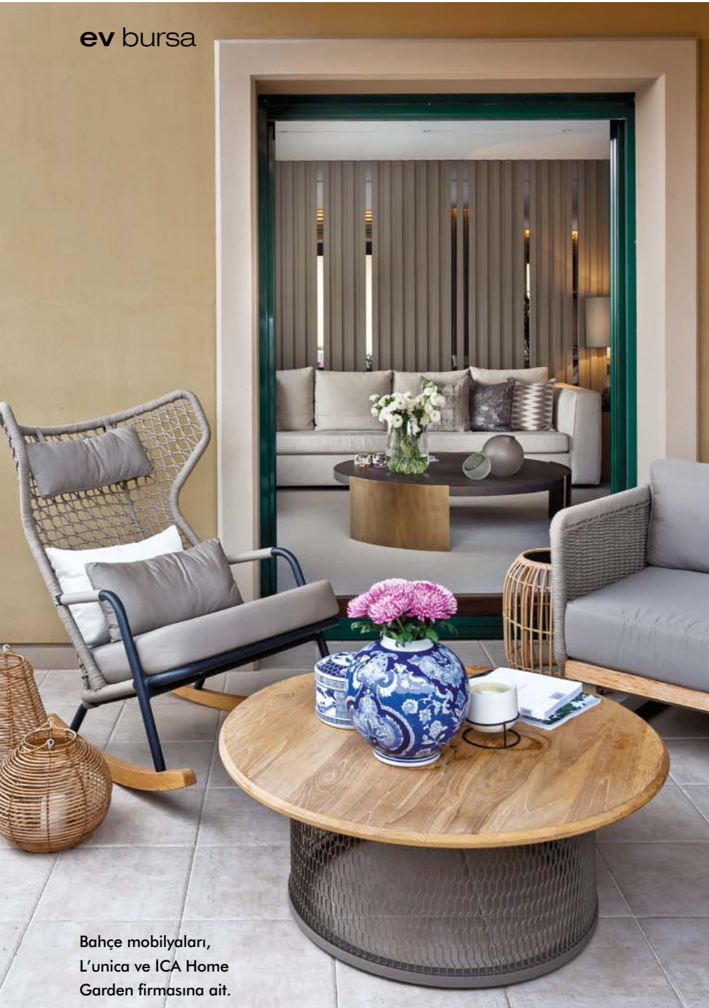
Bahçe mobilyaları, L'unica ve ICA Home Garden firmasına ait.