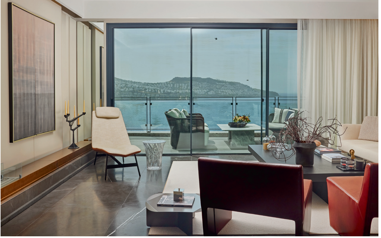
Balkondaki oturma takımı, Snoc. Sehpa, özel üretim mermer. Perdeler, Plus perde. Şamdan, Tom Dixon. Uzanma koltuğu, Bonaldo. Şeffaf sehpa, Kartell.