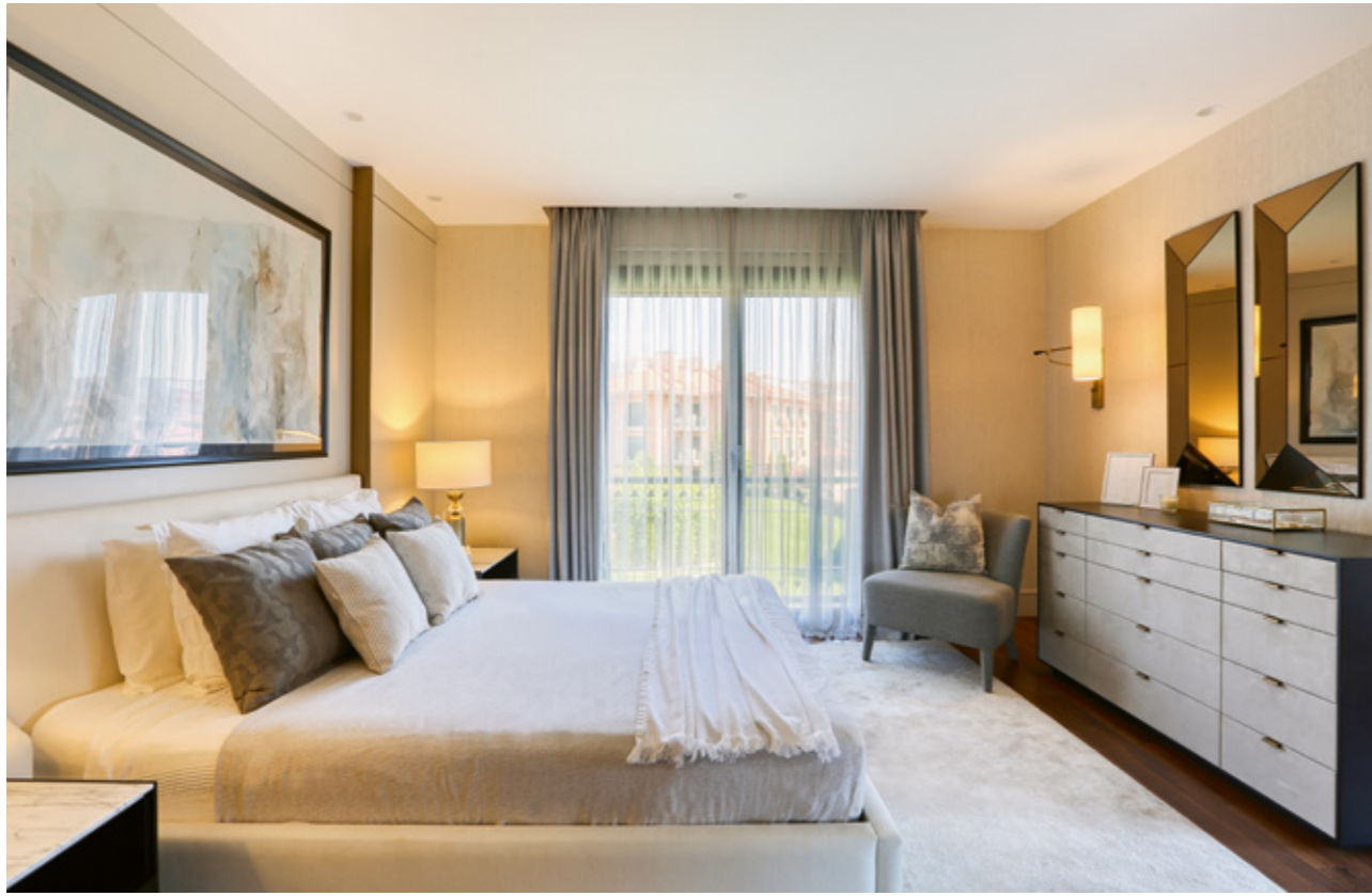
Yatak odasındaki suluboya resim, Frenchouse'dan alınmış. Dikey açılı aynalar, Zara Home, abajurlar ve aplik, Fem Aydınlatma. Giyinme odası için ev sahiplerinin talebi kapalı dolap sistemi olmuş. Mimar bu talebi ahşap ve mermeri bir arada kullanarak çözmüş. "Ahşap sıcaklığına ikinci bir materyal ekleyip mermer makyaj ve hazırlanma masası tasarladık."