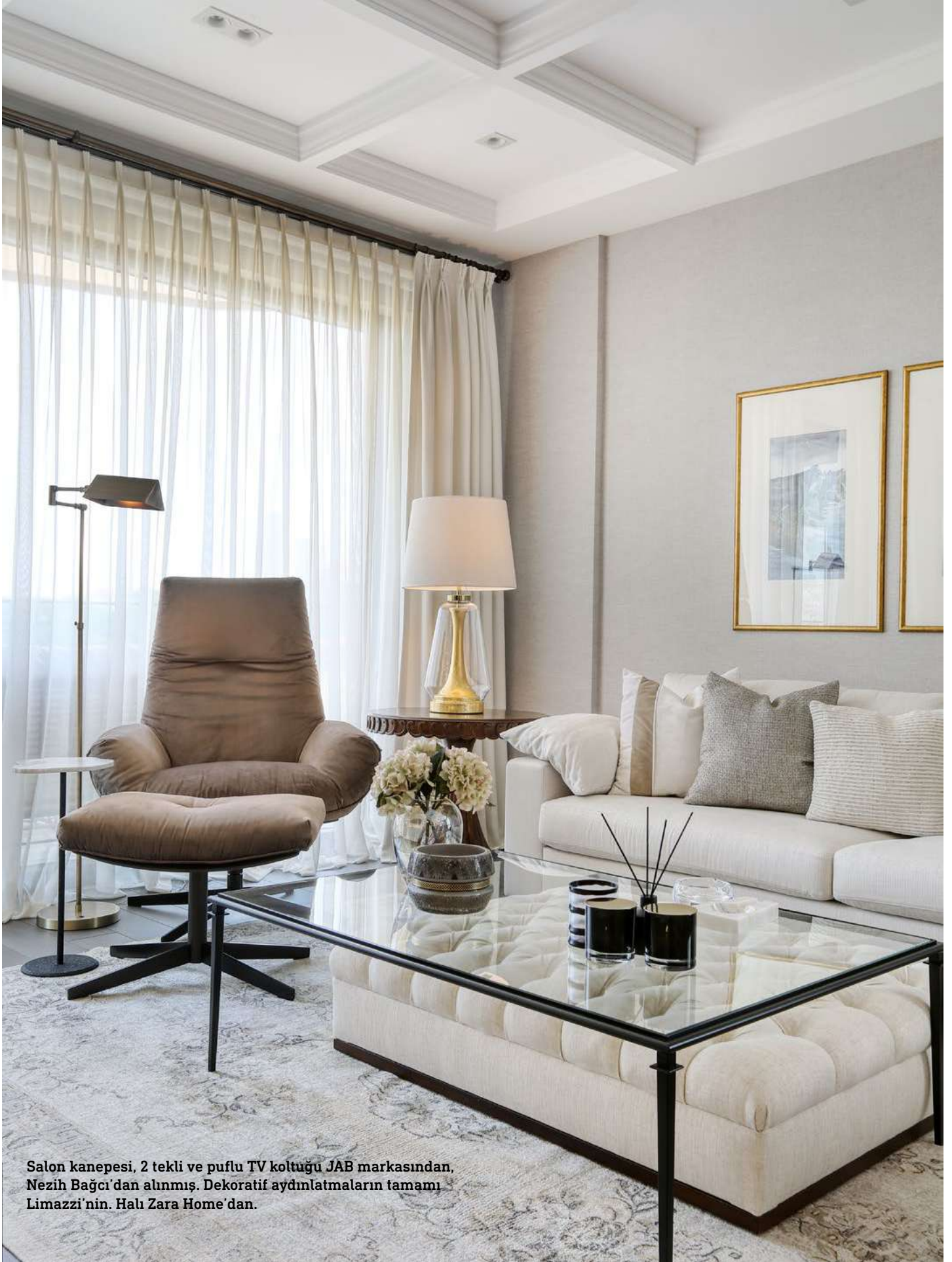
Salon kanepesi, 2 tekli ve puflu TV koltuğu JAB markasından, Nezih Bağcı'dan alınmış. Dekoratif aydınlatmaların tamamı Limazzi'nin. Halı Zara Home'dan.